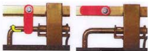
Systeme de sécurité