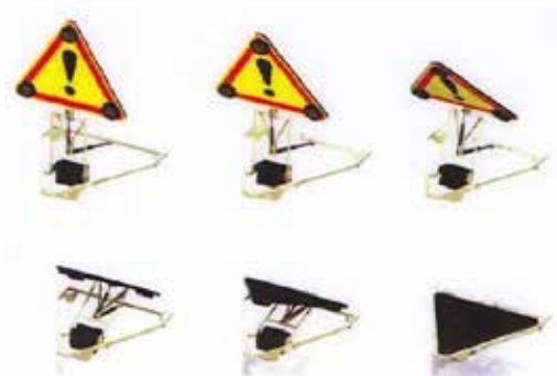
Pliage du triangle