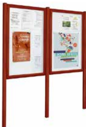
Réf. SP405003 + SP416356 + SP416460