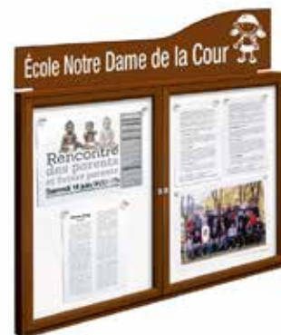
Réf. SP405075 + SP409015