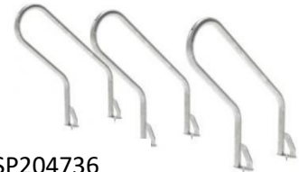
Réf : SP204736