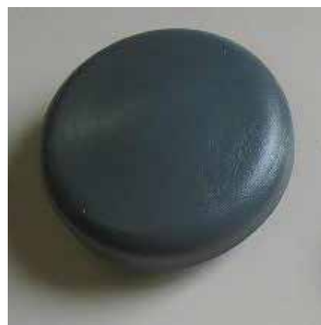
Calotte de protection