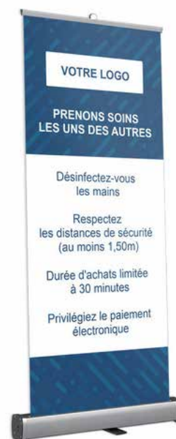
Roll up Eco Format: 85 x 200 cm