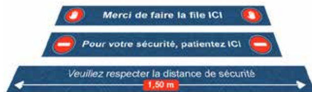
Autocollant long pour sol Formats: 120 x 15 cm / 150 x 15 cm

Complétez un des nos modèles avec votre logo tout simplement et personnalisez-le davantage avec vos couleurs et autres règles complémentaires.