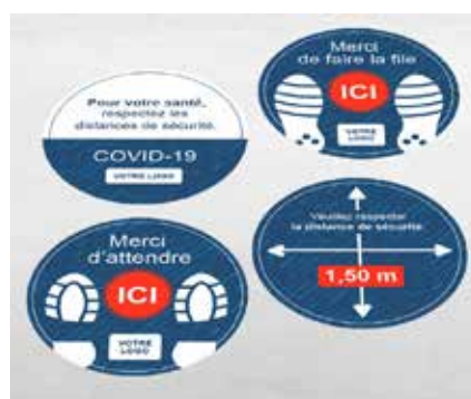
Autocollant rond pour sol. Diamètre: 50 cm.