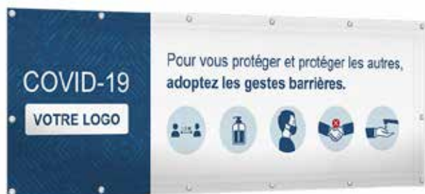
Bâche PVC Format: 240 x 70 cm