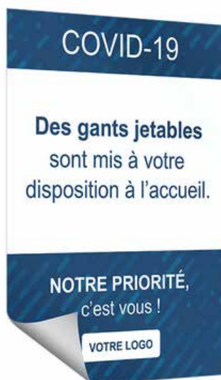
Autocollant pour vitrine Format: 60 x 80 cm