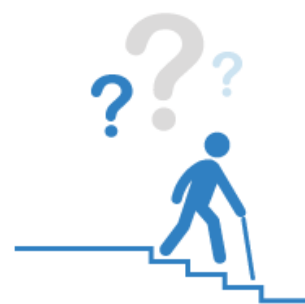
Accessibilité des escaliers pour personnes handicapés

Surface couverte avec 1 kit adhésif = 1350 x 420 mm = 0,567 m 2